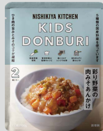
彩り野菜の肉みそあんかけ