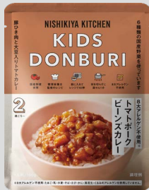
トマトポークビーンズカレー