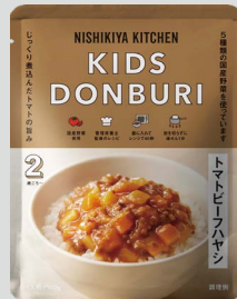
トマトビーフハヤシ