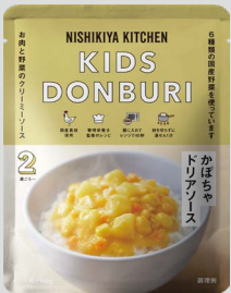
かぼちゃドリアソース