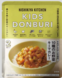
10種のお野菜キーマカレー